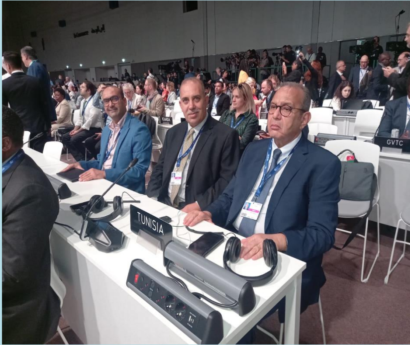
وفد الاتحاد بالجلسة الافتتاحية COP28

اجتماع تنسيق للوفد التونسي حول مسار المفاوضات للاتفاقية الإطارية للأمم المتحدة حول التغيرات المناخية CCNUCC وخاصة النقطة المتعلقة بالهدف الجديد والكمي لتمويل المناخ والنقطة المتعلقة بالانتقال العادل بخصوص آليات تعديل الكربون عبر الحدود CBAM وكذلك الإجراءات أحادية الأطراف في مجال المبادلات التجارية.